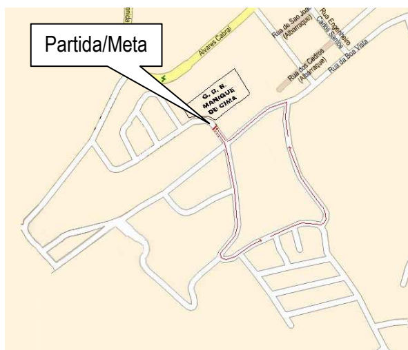
Percurso 1 – 920metros